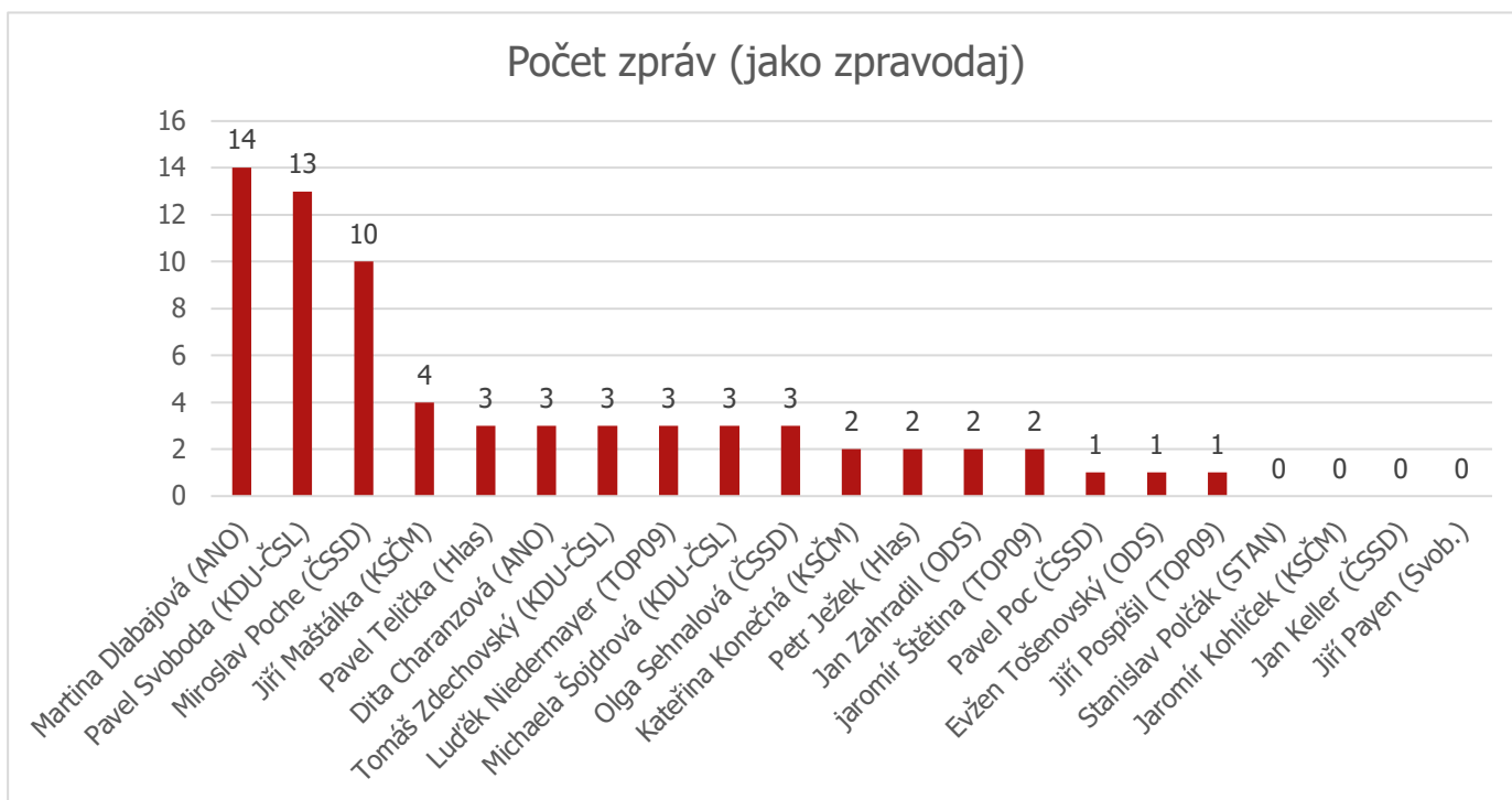
Graf 2

zprávy svěří. Pozice zpravodaje je důležitá z toho důvodu, že zprávy bývají většinou přijaty v podobě, která se velmi blíží původnímu návrhu zpravodaje. Ten je také odpovědný za vyjednávání kompromisního návrhu v rámci EP a tzv. triologu, kterého se účastní také Evropská komise a Rada EU. Poslanec tím má hmatatelný dopad na finální podobu přijatého legislativního aktu. Z tohoto hlediska se jako velmi úspěšní jeví především europoslanci Martina Dlabajová (ANO), Pavel Svoboda (KDU-ČSL) a Miroslav Poche (ČSSD). Zároveň ale platí, že „není zpráva jako zpráva“. Některé zprávy jsou velmi složité a zaberou poslanci hodně času a energie (nařízení, směrnice), některé jsou méně významné (zprávy z vlastního podnětu) a jiné vyloženě technické (např. absolutoria rozpočtu).