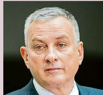
Jozef Síkel (STAN) ministr průmyslu a obchodu