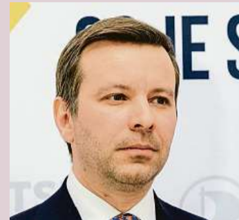
Marcel Kolaja (Piráti) europoslanec a lídr kandidátky